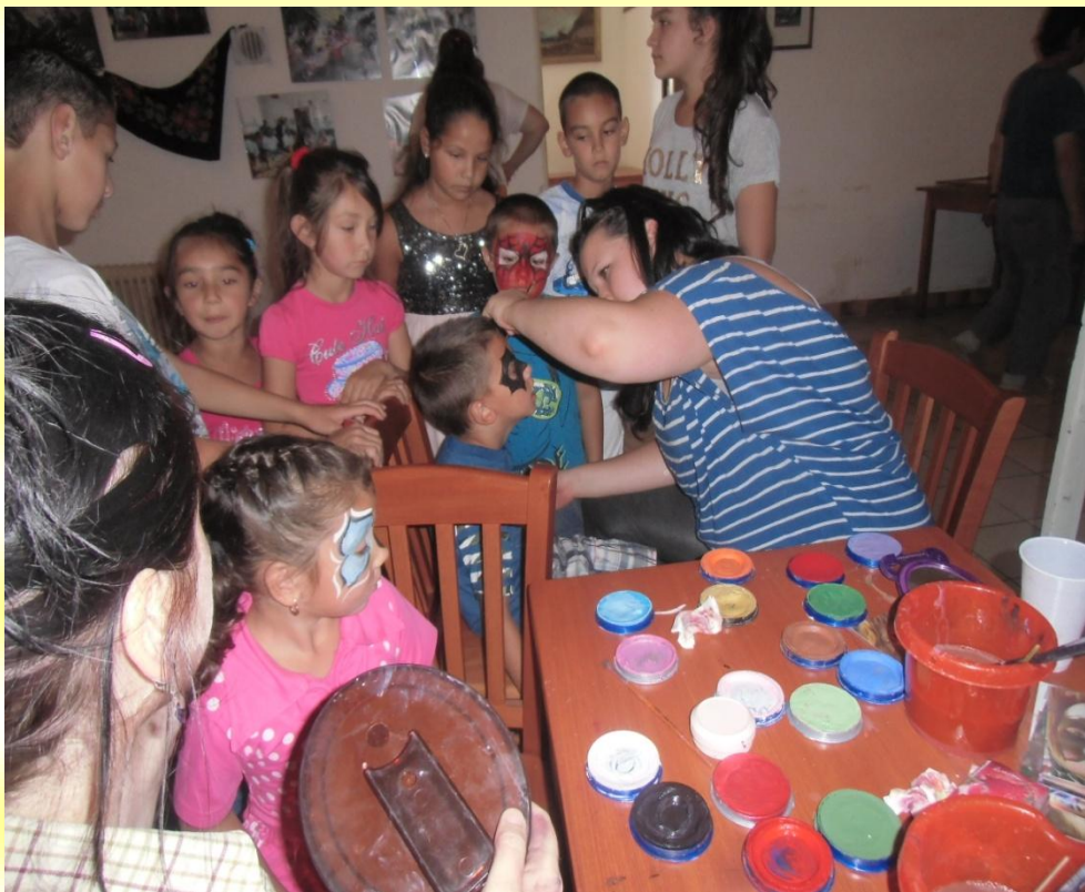
MALOVÁNÍ NA OBLIČEJ