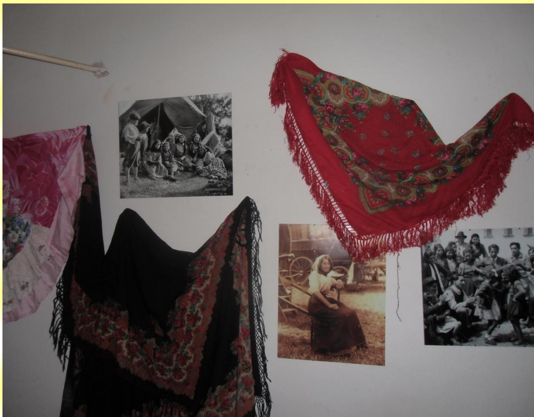
VÝSTAVA KROJŮ A FOTOGRAFIÍ