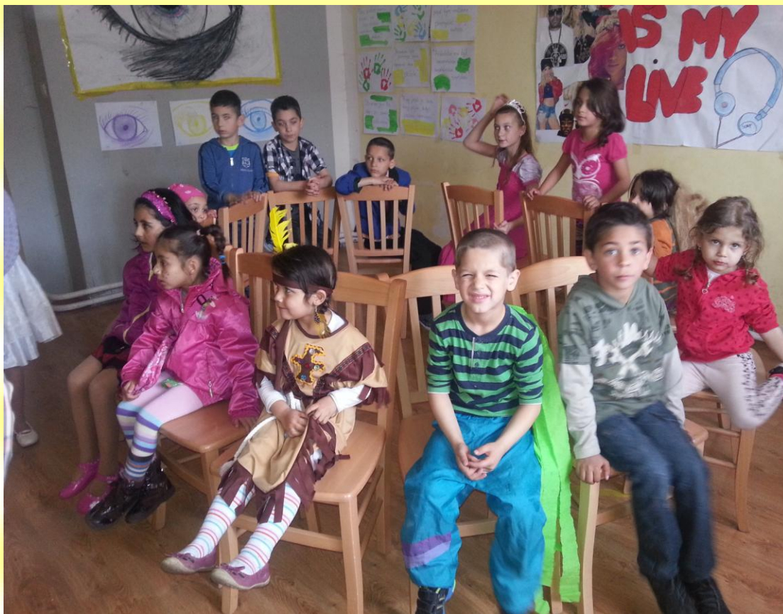
KARNEVAL PRO DĚTI